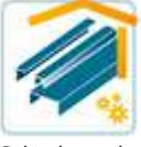
Geländer und Metallbau