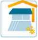
Beschattung / Markisen