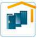
Türen und Vordächer