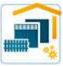
Zaun und Toranlagen