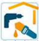
Trockenbau / Renovierung